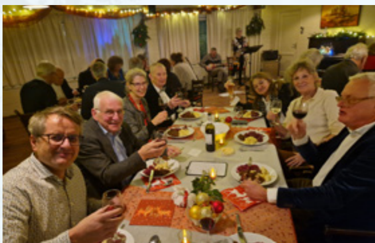
Kerstdiner Vereniging Bosch en Duin