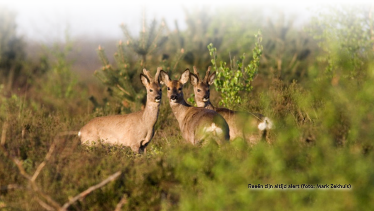
Reeën zijn altijd alert

Dat de ree er zo vroeg bij is, is een kwestie van energiebeheer. Als kieskeurige fijnproever leeft hij van energierijke plantendelen die in het groeiseizoen rijk zijn aan suikers en eiwitten. De zomerse bronst kost vooral de reebok aanzienlijk wat calorieën. Het voordeel is evident: na afloop blijft er nog volop tijd om in de nazomer weer op krachten en vetreserves te komen, voordat de winter zijn intrede doet.