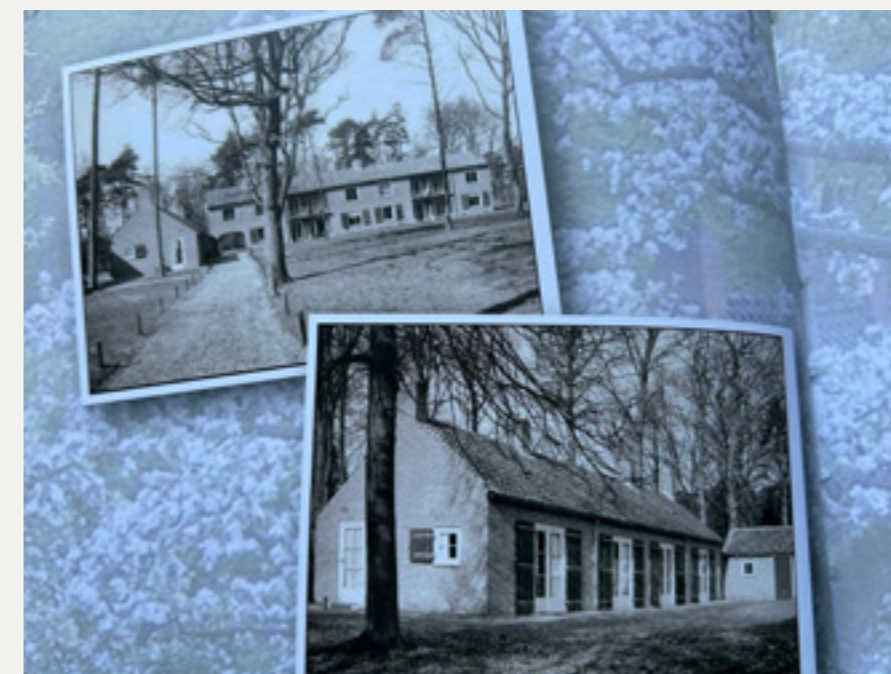
Huisjes type A en B