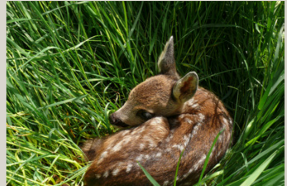
Reekalf vindt dekking in het hoge gras

Na de geboorte parkeert de reegeit haar kroost zorgvuldig in hoog gras of onder wat strategisch gekozen struikgewas. Vluchten zit er voorlopig