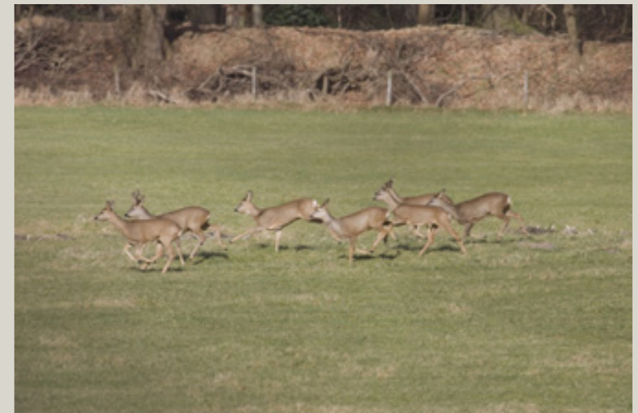
Een sprong reeën